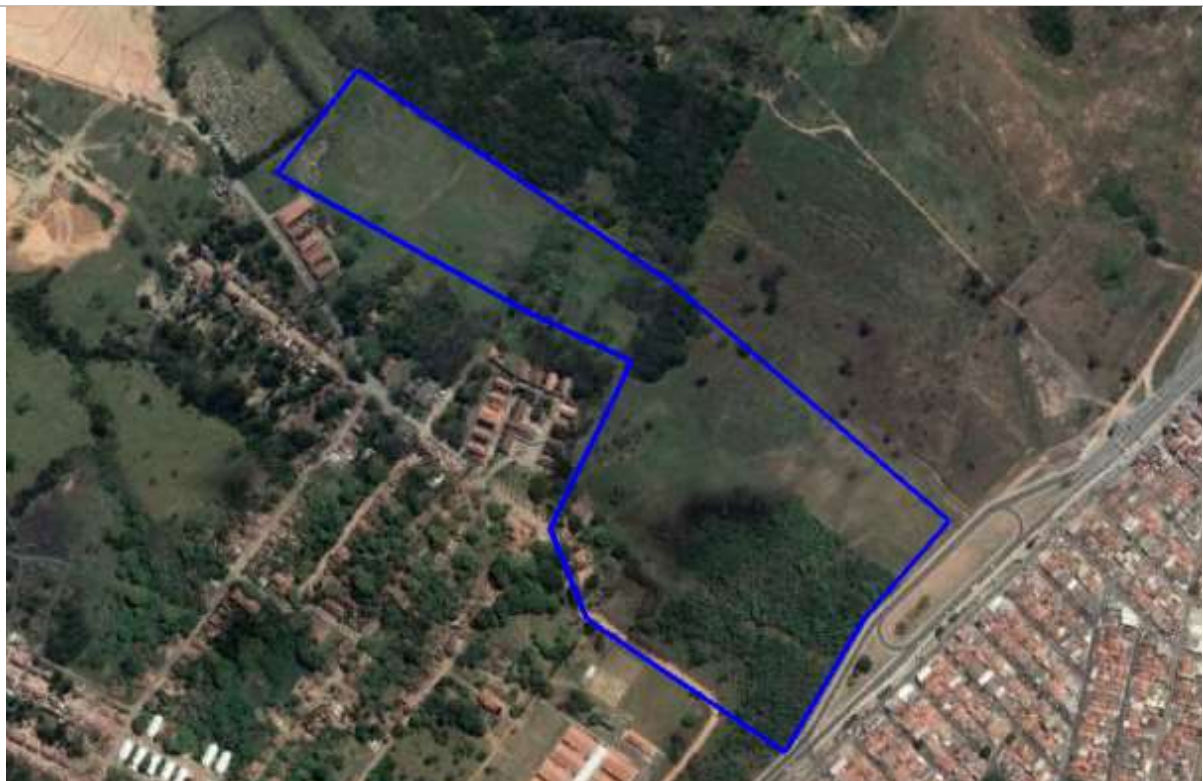
Delimitação do Terreno