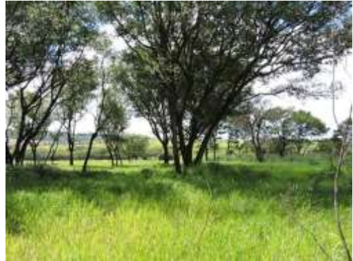
Aspecto do imóvel, matrícula 92731