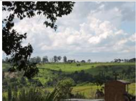
Aspecto do imóvel, matrícula 92731