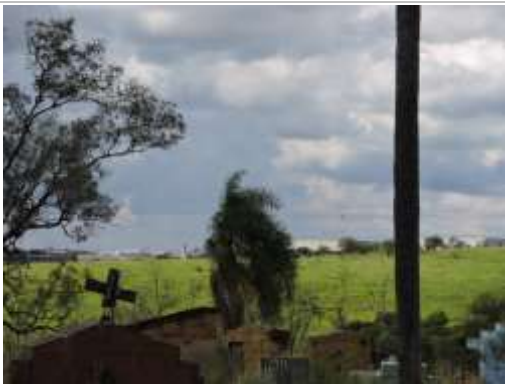
Aspecto do imóvel, matrícula 92731