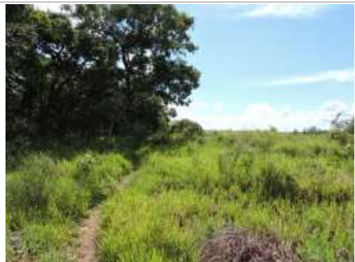
Aspecto do imóvel, matricula 92731