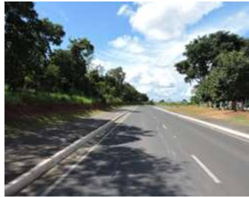
Rua Paraná (Rodovia Waldomiro Correia de Camargo – SP 079) com imóvel a esquerda