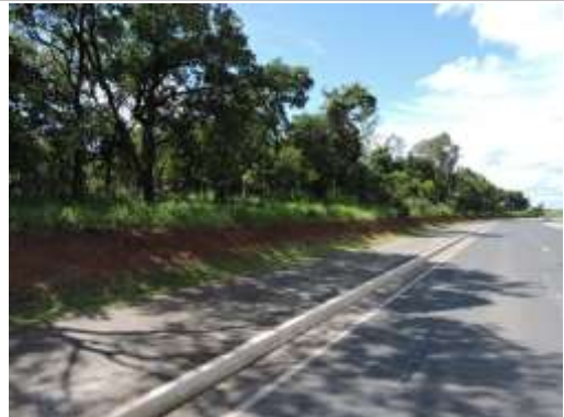
Rua Paraná (Rodovia Waldomiro Correia de Camargo – SP 079) com imóvel matricula 92731 a esquerda