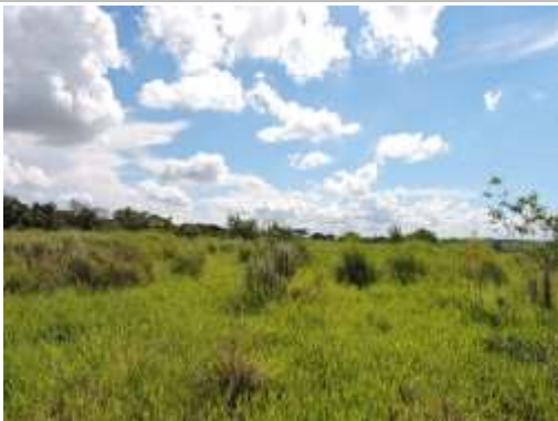
Aspecto do imóvel, matricula 92731