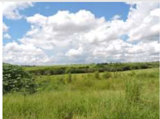
Aspecto do imóvel, matrícula 92731