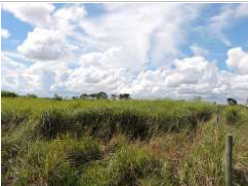
Aspecto do imóvel, matricula 92731