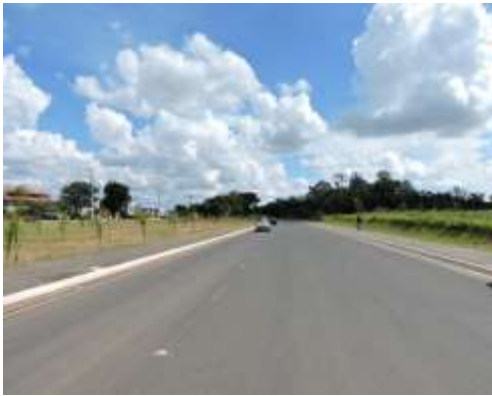
Rua Paraná (Rodovia Waldomiro Correia de Camargo – SP 079) com imóvel direita