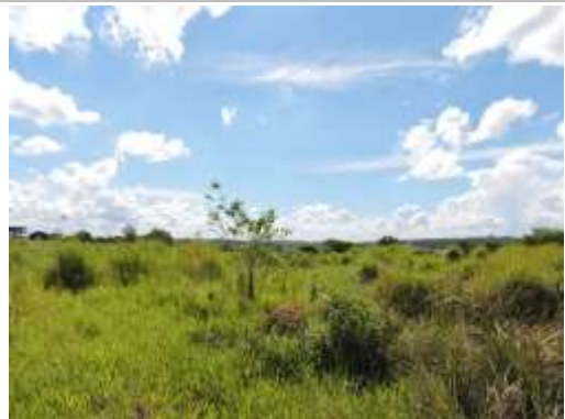
Aspecto do imóvel, matricula 92731