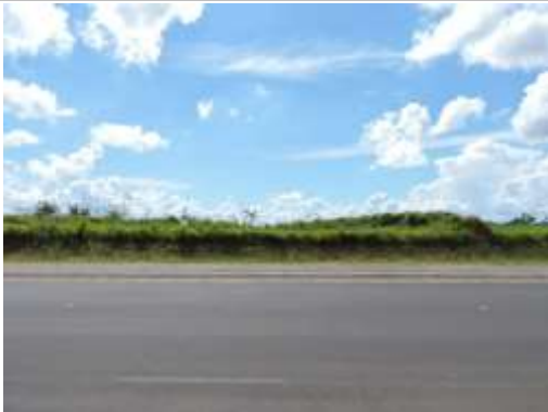
Rua Paraná (Rodovia Waldomiro Correia de Camargo – SP 079) com imóvel matricula 92731