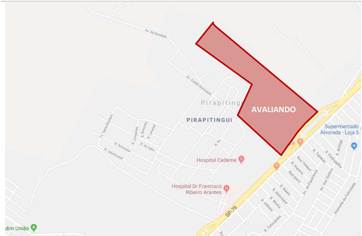
Mapa de Localização do Imóvel

O mapa a seguir ilustra a localização do imóvel na região: