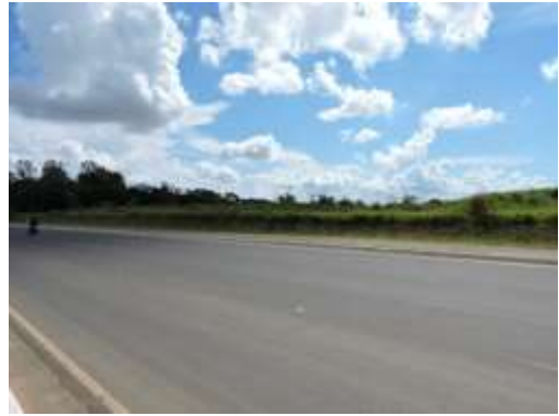
Rua Paraná (Rodovia Waldomiro Correia de Camargo – SP 079) com imóvel matricula 92731