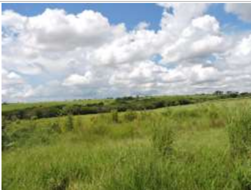
Aspecto do imóvel, matrícula 92731