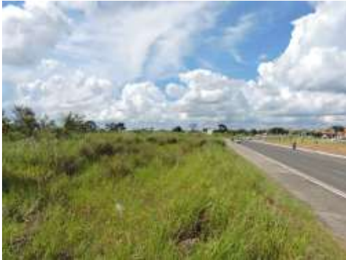
Aspecto do imóvel, matrícula 92731