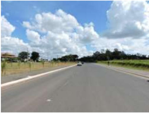
Rua Paraná (Rodovia Waldomiro Correia de Camargo – SP 079) com imóvel matricula 92731 a direita